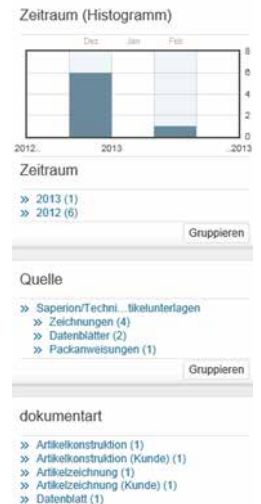
Abb. 1 Einschränkungskriterien (Facetten)

Geschäftsdokumente, wie Rahmenverträge, Packanweisungen, Datenblätter oder Konstruktionspläne übersichtlich angezeigt und können aus der Unternehmensweiten Suche direkt geöffnet sowie bearbeitet werden. (Abb. 2)